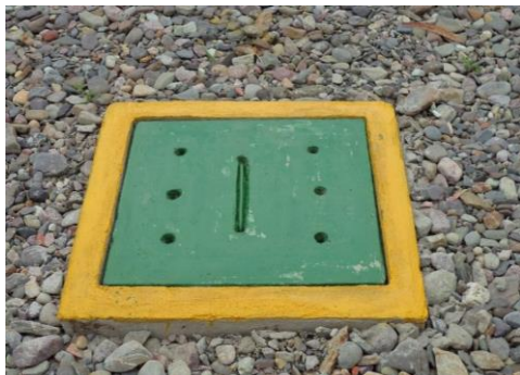
FOTO 11 VISTA CAMARA