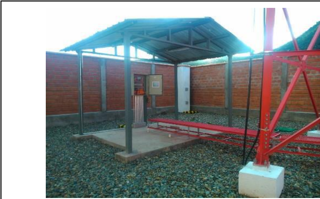
FOTO 3VISTA DE LOSA DE EQUIPOS