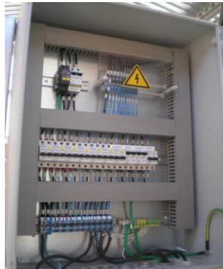
FOTO 7 VISTA TABLERO DE DISTRIBUCION PRINCIPAL