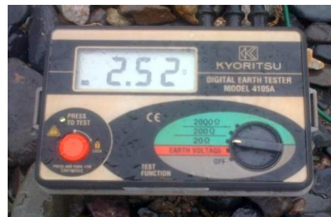
FOTO 12 MEDICION TIERRA