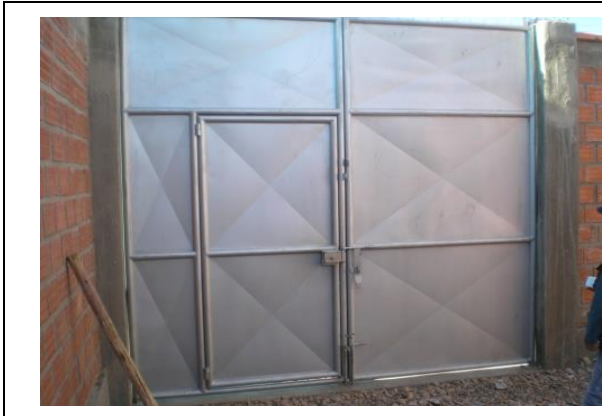
FOTO 6VISTA PORTON O PUERTA DE INGRESO