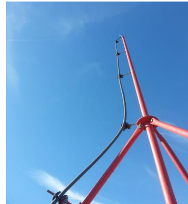
FOTO 10 VISTA PARARRAYOS