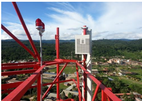
FOTO 9 VISTA SOPORTE DE ANTENAS RF