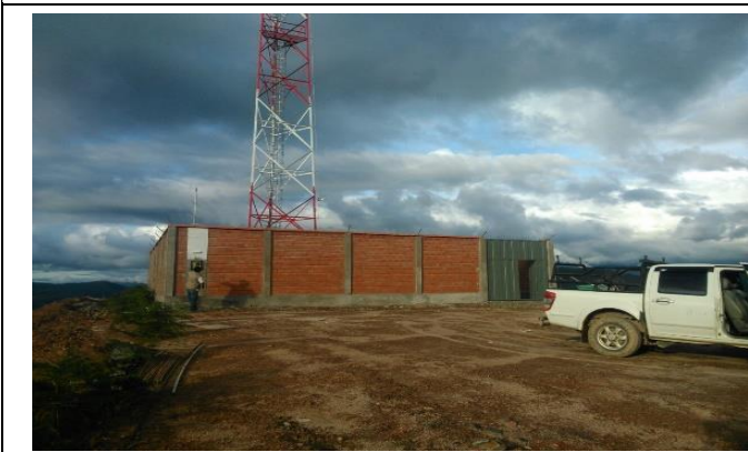
FOTO 1VISTA GENERAL DEL SITIO